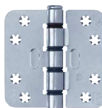
Smart Easyfix® Standaard