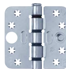
Smart Easyfix® Veiligheid