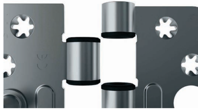
Afgeschuinde AXApom lagerbussen (met fixatiekraag), die onmogelijk uit het bled kunnen vallen.

De stervormige schroefgaten zorgen voor een groter steunvlak voor de schroeven, waardoor de hechtingsdruk toeneemt en homogener verdeeld wordt. Hierdoor reduceert de kans op het afdraaien van de schroefkop, daalt de kans op storingen en neemt de verwerkingsnelheid toe. De strakke vormgeving met de doorgezette knoop, waardoor geen voorsponning meer hoeft te worden gefreesd, maakt de AXA Smart Easyfix® breed toepasbaar. De standaard AXA Smart freesmaten en gatenpatroon maken het mogelijk laat in het productieproces de keuze voor het type scharnier te bepalen.