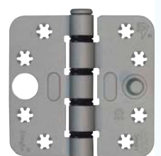
Smart Easyfix® Veiligheid Xtremecoat